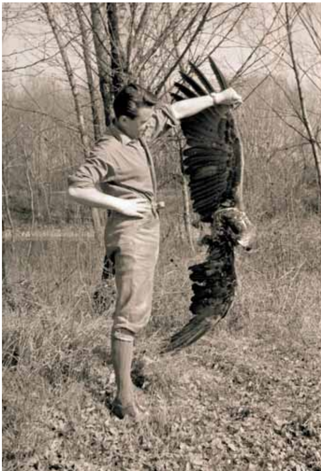
Abb. 4: Todfund eines Seeadlers am 18. März 1961 im Bereich Mühlleiten, Lobau (Foto: B. Leisler). — A White-tailed Eagle found dead around Mühlleiten, Lobau, on March 18, 1961.

war der Schwarzstorch zu dieser Zeit in Österreich nur ein sehr seltener Brutvogel; z. B. BAUER & GLUTZ VON BLOTZHEIM 1966). Definitive Bruthinweise für einen Seeadler waren jedenfalls nicht zu finden. Auch zur Brutzeit im April 1960 und 1961 erwies sich der Horst als unbesetzt. Anfang März 1963 kreiste ein Seeadlerpaar über dem engeren Horststandort, und am 9. März rief ein direkt am Horst sitzender Adler intensiv. Bei einer Überprüfung im April war der Horst allerdings abermals unbesetzt.