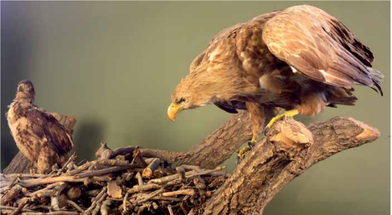
Abb. 2: „Horstgruppe“ mit zwei Altvögeln und einem Nestling in der Schausammlung des Naturhistorischen Museums in Wien. Die Altvögel zählen zu den letzten von Kronprinz Rudolf von Österreich geschossenen Seeadlern. — Mounted „nest group“ with two adult birds and one nestling in the permanent display of the Museum of Natural History in Vienna. The adults rate among the last White-tailed Eagles shot by Crown Prince Rudolf of Austria.

ten sie bereits am Tag der Jagd, dass sich ihr Todesschütze bald das Leben nehmen wird“.