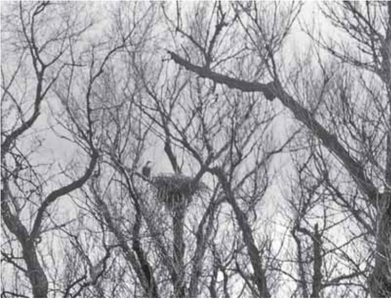
Abb. 3: Fotografische Dokumentation des Seeadlers von Mühlleiten am 15. März 1959 durch H. Freundl. — Photographic documentation of the White-tailed Eagle of Mühlleiten by H. Freundl, March 15, 1858.